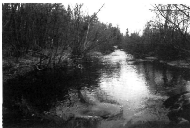
FIGURE 5. L'asymétrie de la coupe transversale sur le côté déboisé (à droite).

Erosion of the stream bank by rills developed on the logged slope.