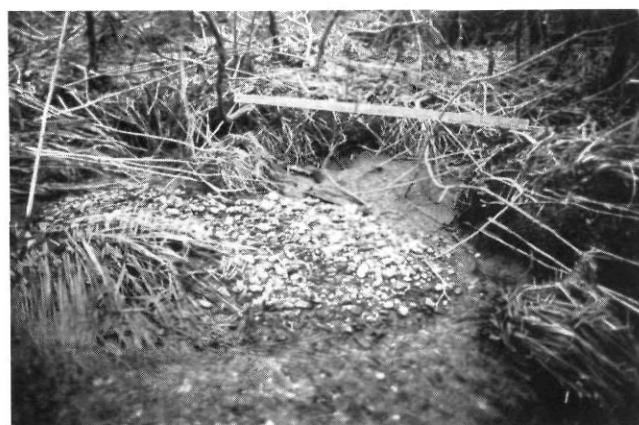
FIGURE 4. Entailles de la berge par des rigoles à proximité du cours d'eau au pied du versant déboisé.

Rill development near the stream channel (behind the bushes).