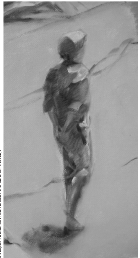
M. Lepezer, Détail de Prison brésilienne-Garandiru (2002).

Ce sont toutes ces preuves, ces centaines de pages, ces milliers de « confessions » sur lesquelles s'arrête le regard du documentariste. Le cinéma de Rithy Panh est à la fois un cinéma de l'exposition, de l'explo-