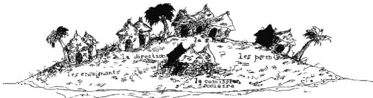
Figure 1 : L'île scolaire

Une des tribus de l'île scolaire est celle des directrices et directeurs d'établissements. C'est une tribu très particulière : ses membres sont issus d'une autre tribu, celle des enseignants. Ils habitent toujours avec ces derniers tout en vivant un peu en ermites. De plus, ils se déplacent régulièrement pour rencontrer la tribu des cadres scolaires, ils organisent des rencontres avec celle des parents et ils discutent fré-