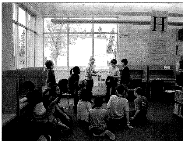
Bien plus qu'un espace dédié au prêt, la Bibliothèque Saint-Jean devient un lieu d'apprentissage, de socialisation et d'échanges.

Les défis sont nombreux sans être insurmontables, mais nous les voyons plutôt comme des opportunités. ◉