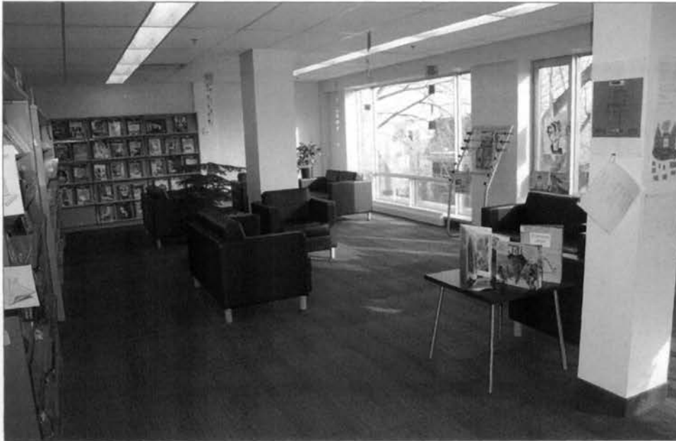
Divans en cuir, fauteuils et poufs géants colorés (très appréciés de la clientèle jeune) invitent les usagers à un moment particulier de lecture et de détente.

collection destinée aux adolescents : la collection Coup de poing. La singularité de cette collection provenait des thématiques éthiques et sociales dont elle traitait : l'affirmation de soi, la différence, l'intimidation, le deuil, la guerre, les inégalités sociales, la dictature, l'amour, la famille, etc.