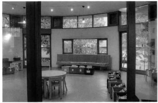
La bibliothèque et une partie du mobilier sont classés depuis 2009.

Sur quoi va alors se concentrer leur offre ? Si offrir un accès à Internet n'a rien de révolutionnaire (cet accès peut être libre comme à Lyon ou restreint à une sélection de sites comme à Noisy-le-Sec 8 ), l'originalité des médiathèques se situe dans leur portail d'accès à Internet. Qu'il s'agisse du site Internet de la bibliothèque ou d'une page Web locale, le portail d'accès présente l'immense intérêt de mettre en valeur des sites classés en fonction de l'âge des enfants et de leurs champs de prédilection. Jeux, livres, cinéma, musique,