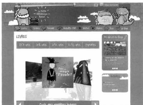
Capture écran 2 : Le portail jeunesse : <www.petitebiblioronde.com>

MuseoGames 24 , c'est une « œuvre interactive dont l'objectif premier est de distraire ses utilisateurs et qui utilise pour sa reproduction un appareil basé sur une technologie informatique ». De fait, le jeu vidéo fait interagir une large série de moyens : la narration, le graphisme, la cinématique, la mise en scène, la musique, mais également le « gameplay » qui traduit l'immersion dans un univers. Contrairement au livre et au cinéma, le jeu vidéo implique totalement ; il engendre des décisions réelles sur les actions de l'histoire créant une lecture singulière... On parle de « narration interactive » et d'« engagement vidéo-ludique ». Le jeu vidéo est une matière à penser : penser le monde et se penser soi-même 25 . Davantage que la lecture proposée initialement par ses créateurs, ce qui compte c'est bien l'expérience émotionnelle, interactive, vécue par le joueur et qui en fait un média aussi riche sinon plus riche que les précédents.