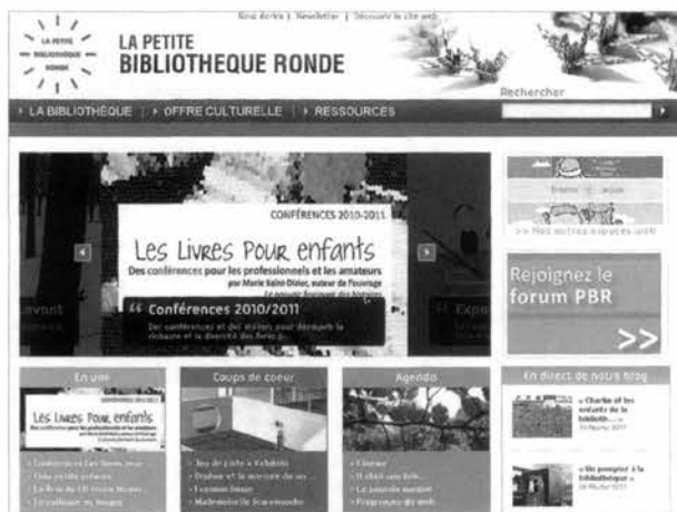
Le site Internet de la Petite Bibliothèque Ronde : < www.lapetitebibliothequeronde.com >

systématiquement dans le top 3 chez les 4-17 ans tandis que la part occupée par la télévision et par l'informatique va augmenter avec l'âge des enfants. La lecture, en seconde position chez les 4-9 ans, n'est plus qu'en huitième position chez les plus grands : 70 % des enfants déclarent aimer lire, mais 50 % évoquent l'obligation par l'école ou lire en situation d'ennui.