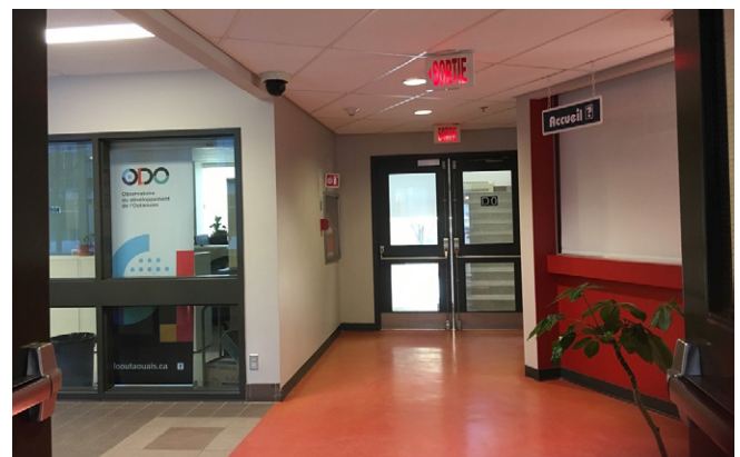
Figure 4. L'ODO, à l'entrée de l'UQO