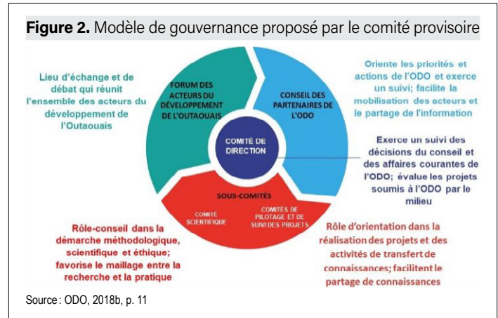
Figure 2. Modèle de gouvernance proposé par le comité provisoire

Même avant la création officielle de l'ODO, un comité provisoire régional regroupant de nombreux partenaires du milieu et des acteurs du milieu universitaire a élaboré le modèle de gouvernance qui devait guider la mise en place de l'observatoire (ODO, 2018b). Comme la figure 2 le montre, ce modèle prévoit la création de trois instances auxquelles s'ajoutent des sous-comités.