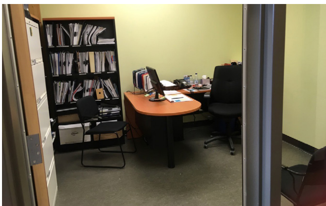
Figure 3. Le bureau de l'Observat