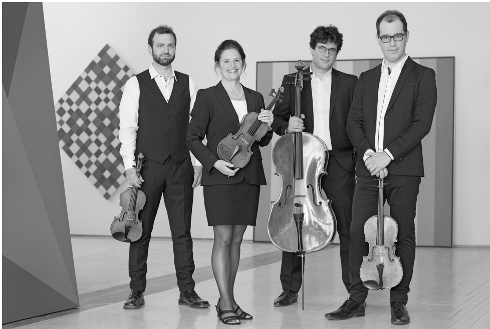
Le Quatuor Molinari, 2018.