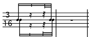
FIGURE 3 Anthony Tan, Observing the Ph(r)ase (2013), structure rythmique de base 14 .

est fondée sur la structure rythmique suivante (voir figure 3), énoncée sous forme d'ostinato à la grosse caisse dans la section centrale (mes. 196 à 234) de la quatrième et dernière partie de l'œuvre.