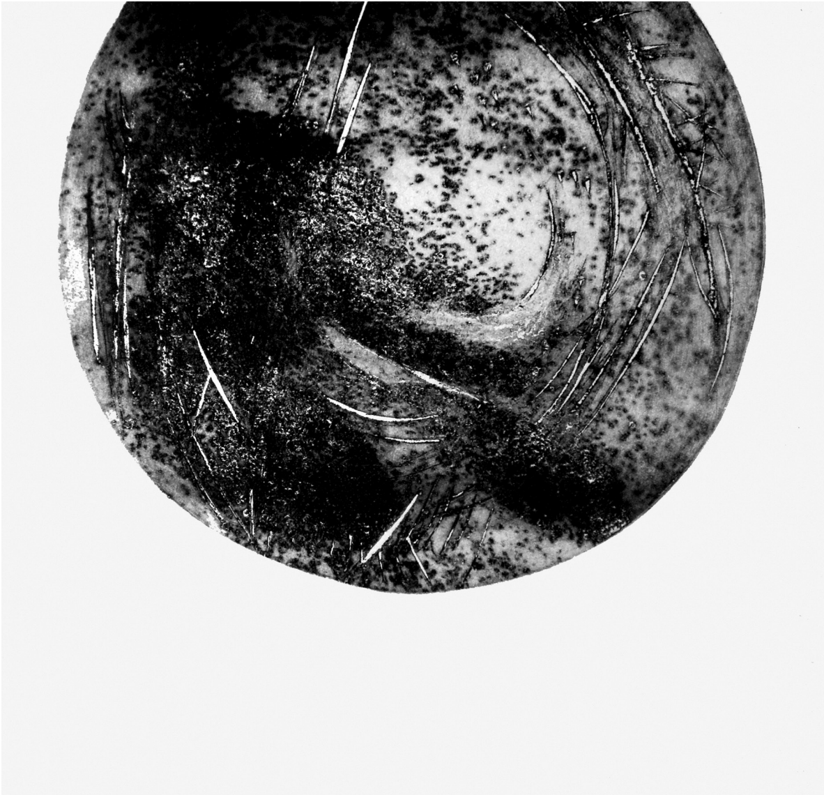
Élisabeth Dupond, Des ronds dans l'eau (2008), intaglio, collagraphie, 51 x 51 cm