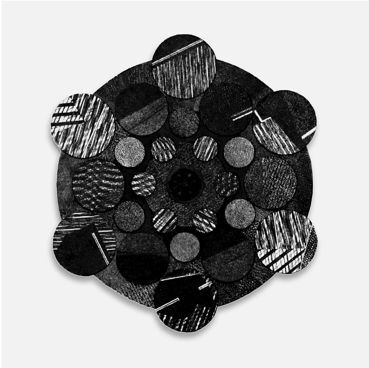
Lorraine Bécic, Hexamorphie 1 (2008), gravure, collage, carborundum, 62,5 x 55 x 4,3 cm