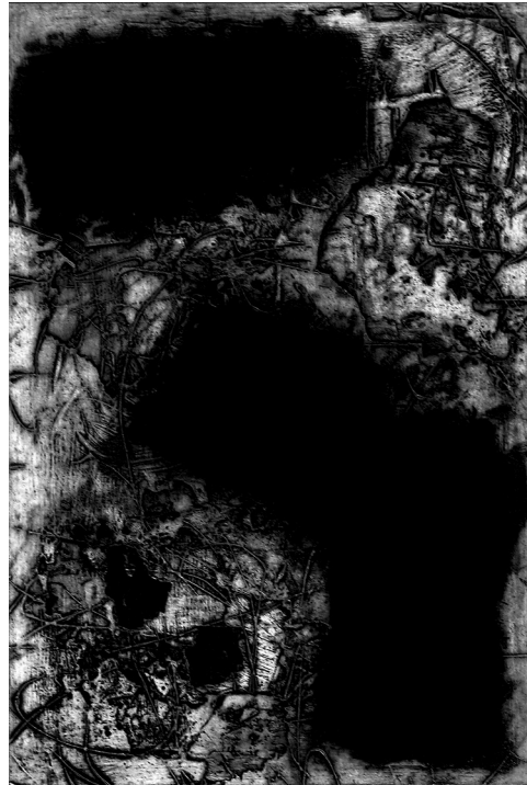
Wah Wing Chan, Lost (2006), carborundum, intaglio, 76 x 51 cm