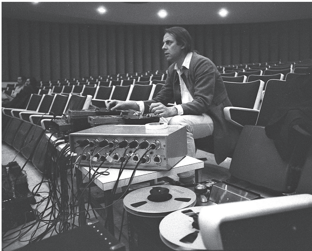
Karlheinz Stockhausen aux contrôles de la diffusion sonore durant une répétition des concerts des 2 et 3 mars 1971, salle Claude-Champagne (Montréal).