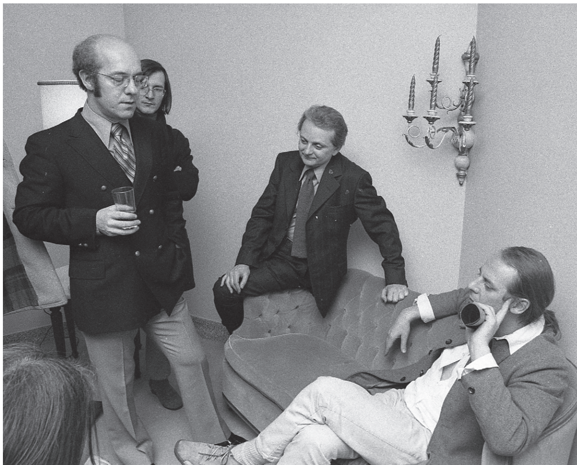
Serge Garant, Claude Vivier, Istvan Anhalt, Karlheinz Stockhausen, en mars 1971 à Montréal.