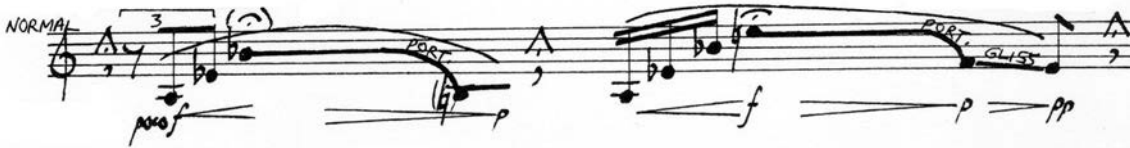
Figure 23 Cinquième Quatuor, page 3, 3 e système

Ces matériaux posés, le travail compositionnel consistera à agencer les transitions, à fondre les passages d'un état à un autre avec le plus de naturel possible. Dans ses échanges avec le public lors de l'événement montréalais de décembre 1999, le compositeur s'est expliqué sur ses intentions :