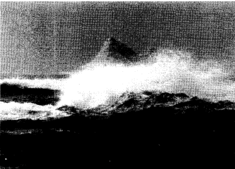
Avant le jour (Lucie Lambert, 1999) La crispation formelle du paysage, s'irréalisant dans la blancheur de l'hiver, vient communier avec la douleur exprimée par les mots. Photographie de plateau, collection personnelle