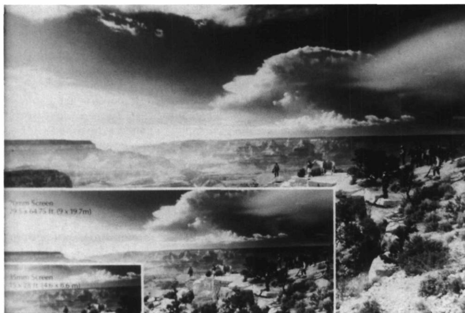
Comparaison entre les formats 35 mm, 70 mm et Imax