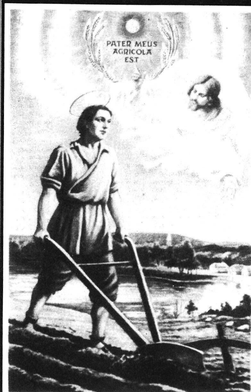
Figure 4 Saint-Isidore le laboureur

MINIATUR PHILIPPI PERREA VS MARANDRILLI ETZ MARTINUS