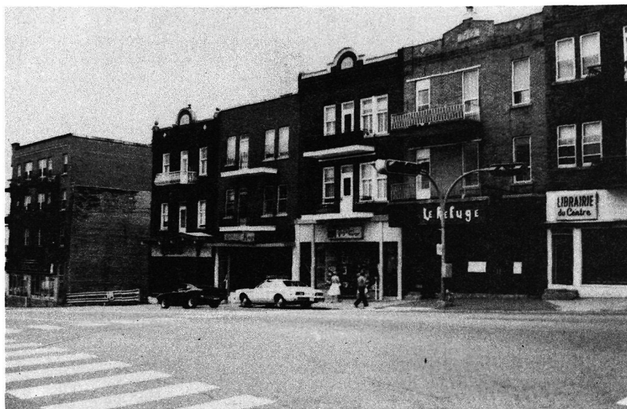
Photo 1. Antenne de quartier, rue de la Station, Shawinigan (commerces, services, professionnels et habitat).

L'absence de maisons artisanales regroupées en faubourg-village (ou noyau de faubourg) conduit à nous pencher immédiatement sur le premier ensemble d'habitations de la phase manufacturière identifié au premier degré d'association. Même s'il se différencie des autres aires d'habitations, ce regroupement morphologique est aujourd'hui difficilement repérable. Il faut puiser dans les données historiques si on veut parvenir à le situer dans le scénario théorique de la forme urbaine. On apprend ainsi que dès le départ de la construction, ces unités ont privilégié la fonction commerciale le long de certains axes. Le zonage fonctionnel n'existe à peu près pas. Les groupes sociaux se retrouvent partout dans cet espace. Les professionnels ou les commerçants occupent le rez-de-chaussée et les ouvriers logent aux étages supérieurs. Cette situation n'a donc guère changé sauf qu'aujourd'hui l'habitat aux étages supérieurs est plus rare et les professionnels occupent le rez-de-chaussée sans l'habiter (photo 1).