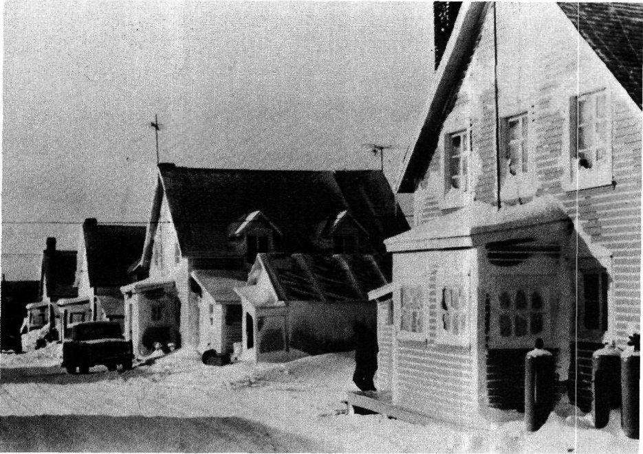
janvier 1979.

(1895), c'était Anse-aux-Fraises située sur la rive méridionale de l'île 5 ; puis, au début du siècle, de nouveau Baie-des-Anglais; enfin, à la fin de l'époque française, Port-Menier sur la baie Ellis. Cette dernière localité s'était fort développée en 30 ans (1896 à 1925) ayant passé de quelques % à plus de 35% de la population insulaire; cette croissance s'est effectuée surtout au détriment d'Anse-aux-Fraises, et non de Baie-Sainte-Claire, cette dernière ayant été le premier choix d'Henri Menier.