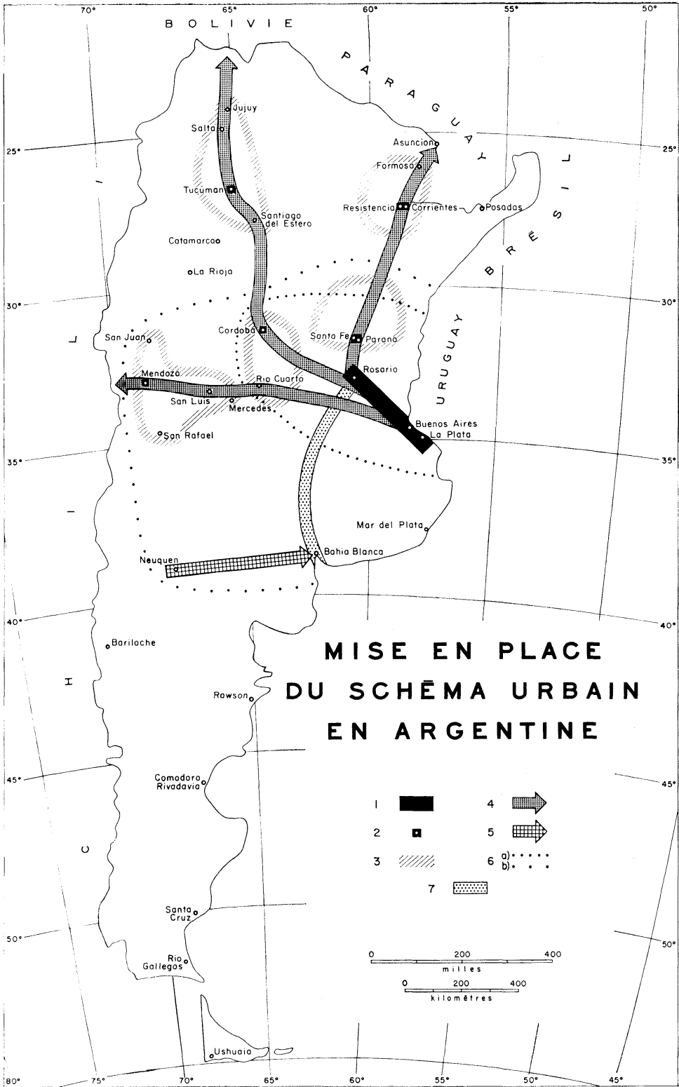
Figure 1 1. Guirlande urbanisée du littoral (ébauche d'une mégapolis ?) ; 2. Métropoles d'équilibre ; 3. Limites des micro-réseaux ; 4. Axes urbains traditionnels ; 5. Axe en puissance du Rio Negro ; 6. Zone à restructurer autour d'un schéma-urbain hiérarchisé : a) priorité 1 b) priorité 2 ; 7. Ceinture de noyaux urbains souhaitable (Rosario - Bahía Blanca).