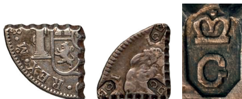
c. Moco de Martinique (1797), moco contremarqué en Guadeloupe (1813) et détail du poinçon (agrandissement). Celui-ci est une copie réalisée par Zay à la fin du XIX e siècle 53 .