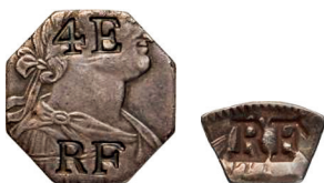
a. Découpes de piastre gourde , le centre valant 4 escalins et une bordure 1 escalin (1802).