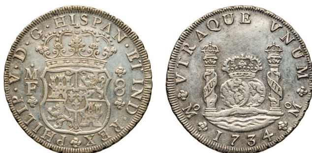
c. Espagne, piastre gourde (8 réaux), 1734, Mexico.