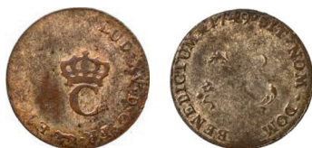
b. Sol « tampe » (C couronné) de 1763, réformé sur un sol « marqué ».