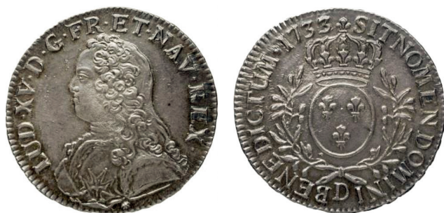
e. France, écu de 6 livres, 1733, Lyon.

Doc. 4 : Principales monnaies précieuses circulant en Guadeloupe dans la seconde moitié du XVIII e siècle.