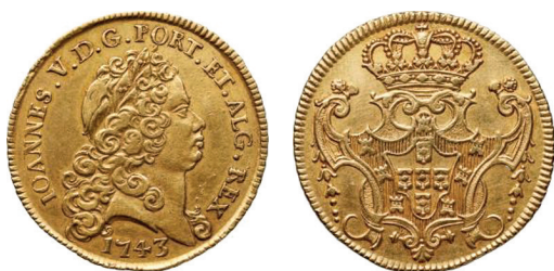
b. Portugal, moëde ou portugaise (6 400 réis), 1743, Lisbonne.