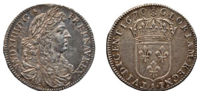
a. Pièce de 15 sols « de la Compagnie des Indes », 1670.