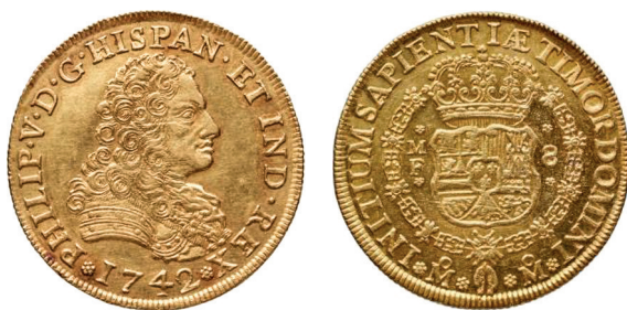
a. Espagne, quadruple (4 pistoles ou 8 escudos), 1742, Mexico.