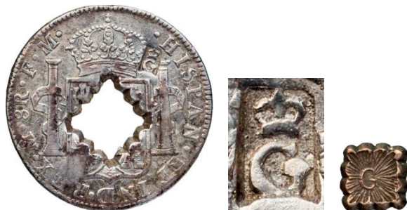
b. Piastre gourde percée, détail du poinçon (agrandissement) et moco de 20 sous correspondant au percement (1811).