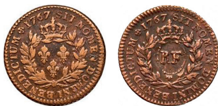
c. Droit du sou de cuivre de 1767 et droit du même sou réformé à la Guadeloupe en 1793.