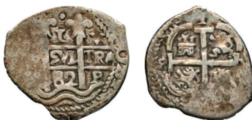
d. Espagne, réal ou escalin, 1682, Potosi.