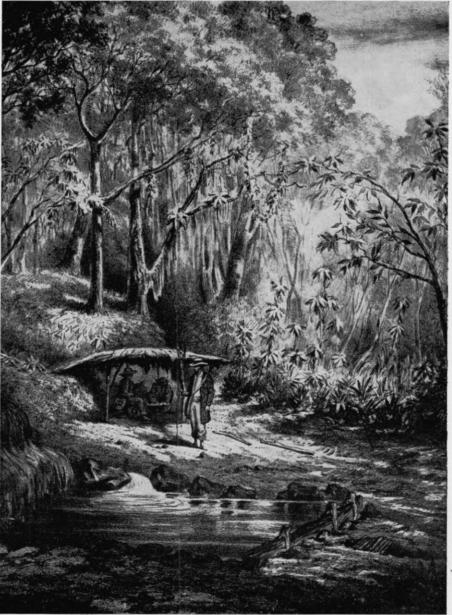
Les Bains Jaunes, sur le chemin de la Soufrière, gravure extr. de l'album, La Guadeloupe pittoresque , publié par Armand Budan en 1863.