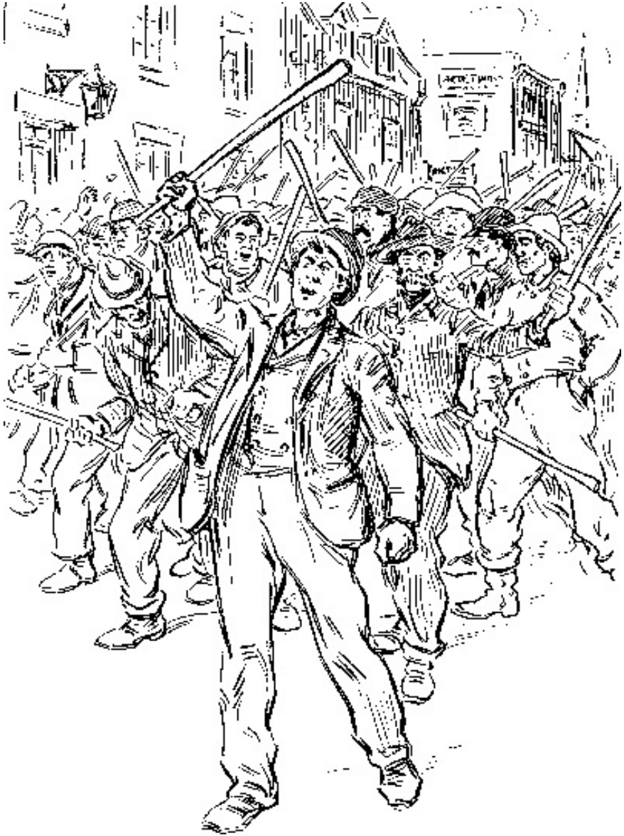
Membres du Doric Club descendant la rue Saint-Jacques, à Montréal, le 6 novembre 1837. Dessin d'Henri Julien, Almanach du peuple (1907).