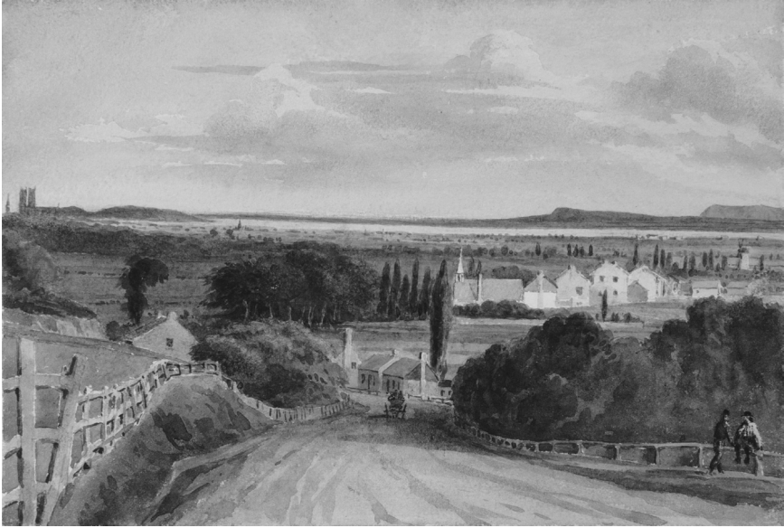
Village des Tanneries des Rolland, près de Montréal, en 1840. Aquarelle d'origine inconnue, Musée McCord, M982.531.9.