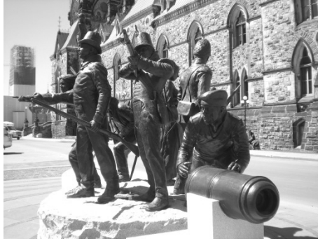
«Le Triomphe grâce à la diversité», monument sur la colline du Parlement.

La lutte pour le Canada 1812-1815: Menée sur les fronts terrestres et maritimes, la guerre de 1812 a tracé l'avenir du Canada. Pour contrer l'invasion américaine, des personnes de différents milieux et origines se sont mobilisées: hommes et femmes; Anglais, Français et Autochtones; militaires et civils. Les personnages représentés sur ce monument reflètent la diversité de ceux et celles qui ont uni leurs forces pour défendre le territoire et assurer l'existence du Canada.