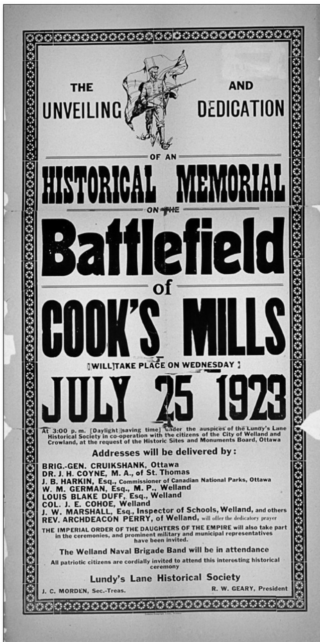
Affiche annonçant la cérémonie d'inauguration d'un monument près de Cook's Mills, 1923.