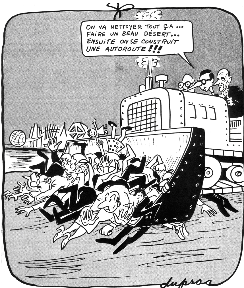
« Non à l'autoroute », brochure publiée par le Front commun contre l'autoroute est-ouest, avril 1971.