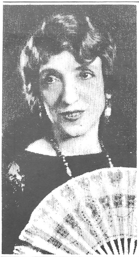
Les deux directeurs artistiques de la Société canadienne d'opérette. Album-souvenir, mai 1928.