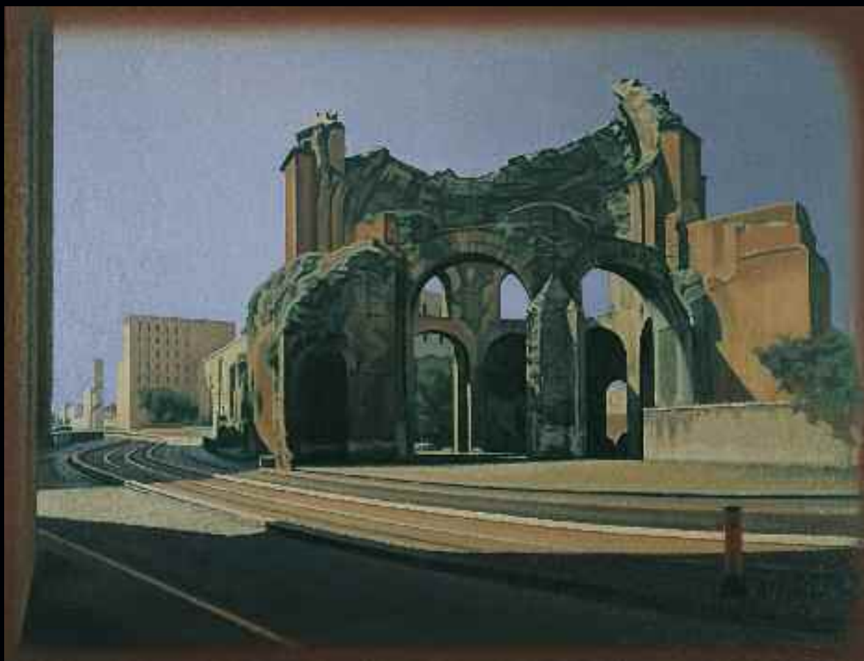
Minerva Medica, 1994. Huile sur toile de lin, 91,5 x 122 cm. Collection Glen Bloomet Deborah Dussy.

À partir de ce moment, il nous semble que Pierre Dorion a solidement mis en place les thèmes qui soutiennent sa pratique : l'installation et l'architecture, les images référentielles, le paysage, le portrait, ses expériences personnelles et l'urbanité. Au plus près de la peinture, de ses paramètres figuratifs ou moins descriptifs, il avance avec rigueur et constance comme il visite les villes, observe les lieux, analyse les espaces, attentif à trouver le point de vue particulier, la lumière parfaite, la couleur évocatrice et la « bonne forme ».