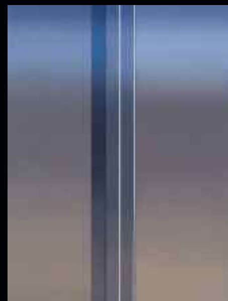
Gap III, 2012. Huile sur toile de lin, 182,9 x 137 cm. Collection Antoine Ertaskiran, Montréal.

Demeure une lenteur sensuelle comme si le temps de la peinture venue de très loin s'écrit au présent et s'absorbe lentement dans un ailleurs indéfini, un ailleurs qui se dissout en intériorité.