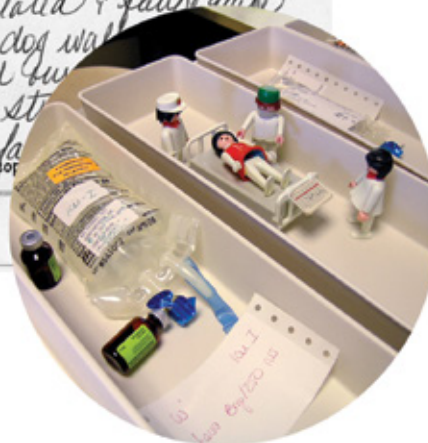
Histoire contre macaron, 1995-2007 Intervention au département des soins intensifs chirurgicaux de l'Hôpital général de Montréal.

Merci de ne pas nommer les gens ni les lieux. Please do not name people or places.