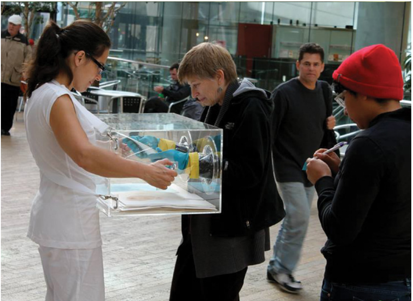
L'incubateur à texte et à dessins , 2014 Performance, PAF - Performance Art Festival, Salt Lake City.