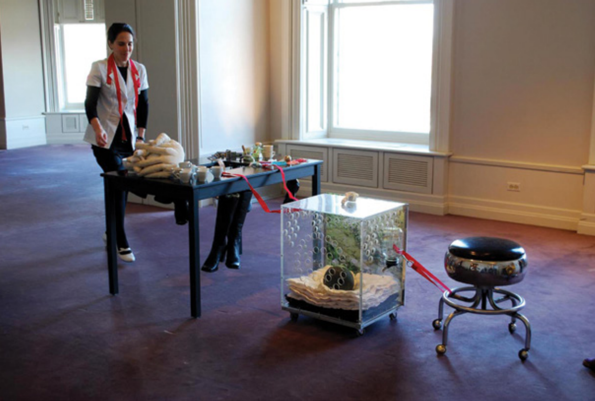
La cartographie du soi , 2012 Performance Centre Canadien d'Architecture, Montréal.