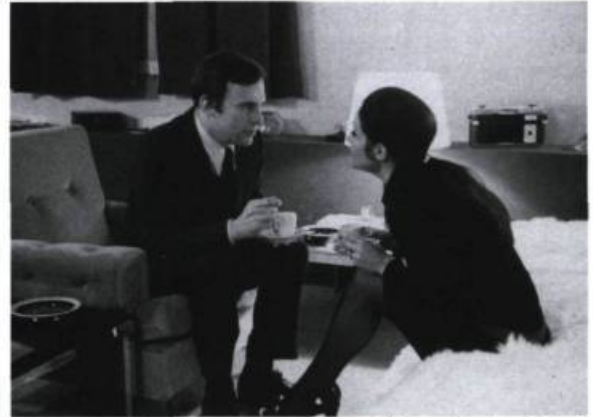
Ma nuit chez Maud

Jérôme déclare ne pas prêter attention à l'amour qu'éprouve la jeune Laura à son égard. De même Jean-Louis insiste sur le fait que « courir les filles, ça ne vous éloigne pas plus de Dieu que faire des mathématiques ». Pourtant, le premier, tout en étant troublé, obsédé par le genou de Claire, accompagne volontiers Laura dans ses promenades et ne manquera pas l'occasion de l'embrasser. Le second poursuit Maud de ses assiduités, l'embrasse aussi, presque comme pour se faire pardonner sa maladresse de la nuit précédente. Des hasards bien préparés, menant à des actions attendues jouées sur le ton badin de l'improvisation la plus naturelle.