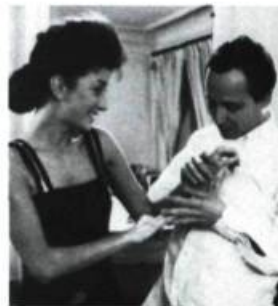
Les Nuits de la pleine lune