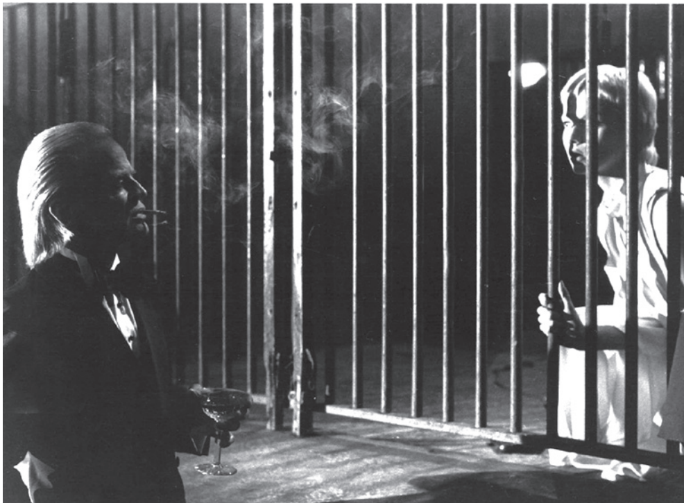
Une révolte contre les dieux

Effectivement, l'opéra se termine sur les célébrations du mariage de Tamino et Pamina en habits sacerdotaux, signifiant la promotion de la femme (comme l'écrit encore Chailley), son accession aux mêmes rangs, donc à la même Connaissance que l'homme dans l'initiation maçonnique, ce qui lui fut longtemps refusé. Ceci résume grossièrement ce que Mozart semble avoir voulu exprimer dans son dernier opéra. Mais revenons au film de Fleischer. Dans la légende du Minotaure, c'est Thésée, un homme, qui entre dans le labyrinthe. Dans Zoo Zéro , le héros antique est remplacé par une héroïne: Éva, fille de Yavé, qui se rebelle contre son père, «révolte contre les dieux»,