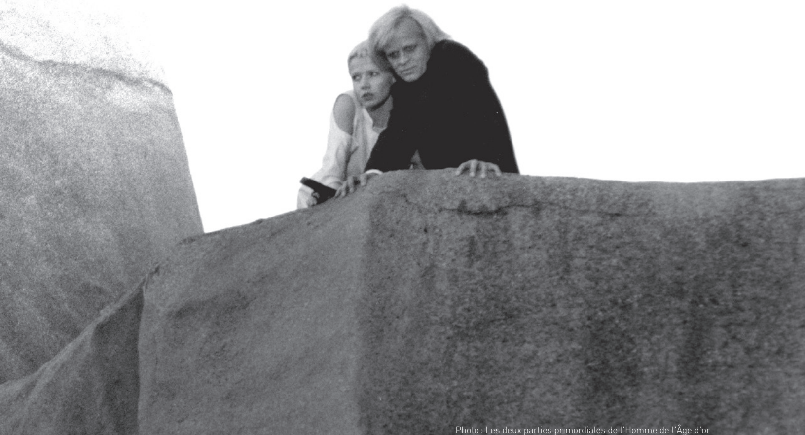
Les deux parties primordiales de L'Homme de l'Âge d'or

La Flûte enchantée est essentiellement, sous une forme symbolique, l'illustration de ce conflit entre les deux mondes, le