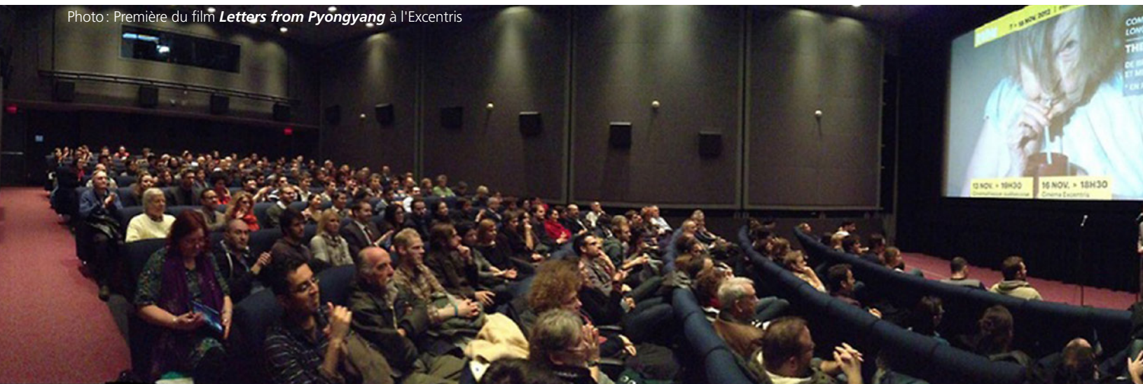
Photo : Première du film Letters from Pyongyang à l'Excentris

les salles de cinéma. Obligés de se démarquer dans un océan de festivals devenus aussi concurrentiels que complémentaires, les organisateurs des plus fréquentés d'entre eux, les RVCQ, Fantasia, FNC et RIDM, n'ont eu d'autre choix que de rajeunir leur image de marque en optant pour un « spectacle » diversifié qui va bien au-delà du simple mandat de présenter des films. Un tournant marketing que n'a jamais réussi le FFM d'ailleurs, engoncé de plus dans une programmation pas toujours à la hauteur.