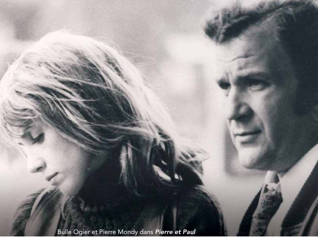
Bulle Ogier et Pierre Mondy dans Pierre et Paul

Oui, dans la mesure où cela ne signifie pas que je sois fermé à la façon dont, ces cinquante dernières années, la science, l'art, la fiction ont entrepris une espèce d'exploration de la notion de durée. Le souci de la durée s'est traduit par des démarches artistiques dont certaines ne sont restées qu'à l'état de recherche tandis que d'autres, je pense à Joyce en particulier, ont d'emblée atteint la plus parfaite plénitude d'une démarche pour trouver son achèvement. Si je ne donne pas libre cours à ce souci formel et esthétique, c'est que, par mes films, je veux m'adresser au plus grand nombre de personnes possible. Bien entendu, la durée que j'adopte est également une convention.