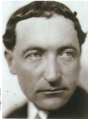
Jules Romains, l'une de ses amitiés françaises

On comprend mieux, maintenant, les ramifications qui lient les dernières œuvres de Zweig à leur contexte historique. Les années 1932-1942 correspondent à une période où Zweig a beaucoup travaillé, en partie par « nécessité extérieure » (le gouvernement autrichien avait gelé ses avoirs bancaires), en partie par « désespoir intérieur ». Rédigeant ses biographies de Marie-Antoinette et de Marie Stuart, ses essais sur Érasme, Magellan et Montaigne, de même que ses souvenirs ( Le monde d'hier ), travaillant à son Balzac qu'il percevait comme son grand œuvre mais qui devait rester inachevé, Zweig a cherché dans l'histoire des motifs de consolation. Incurablement nostalgique d'un héritage des Lumières que la barbarie du XX e siècle venait d'anéantir, Zweig a