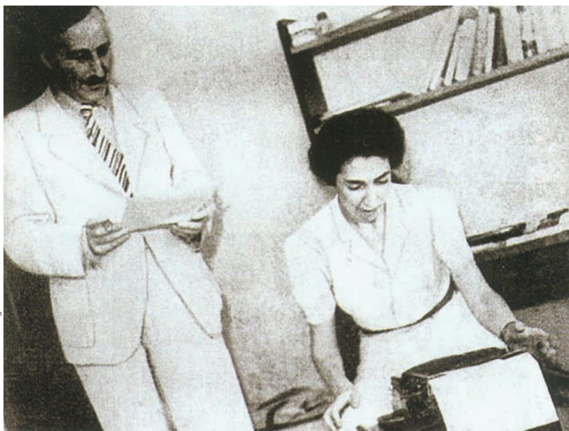
Stefan Zweig avec Lotte : épouse et collaboratrice