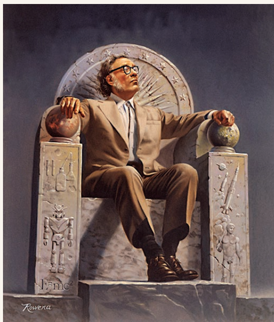
Asimov par Rowena Morrill.

Un individu qui enseigne, qui donne des conférences, sait très bien que ce type d'activité nécessite une part de spectacle. Disons de mise en scène, le besoin de ménager ses effets,