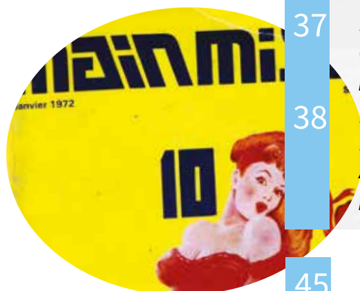
Mainmise, n° 10, janvier 1972