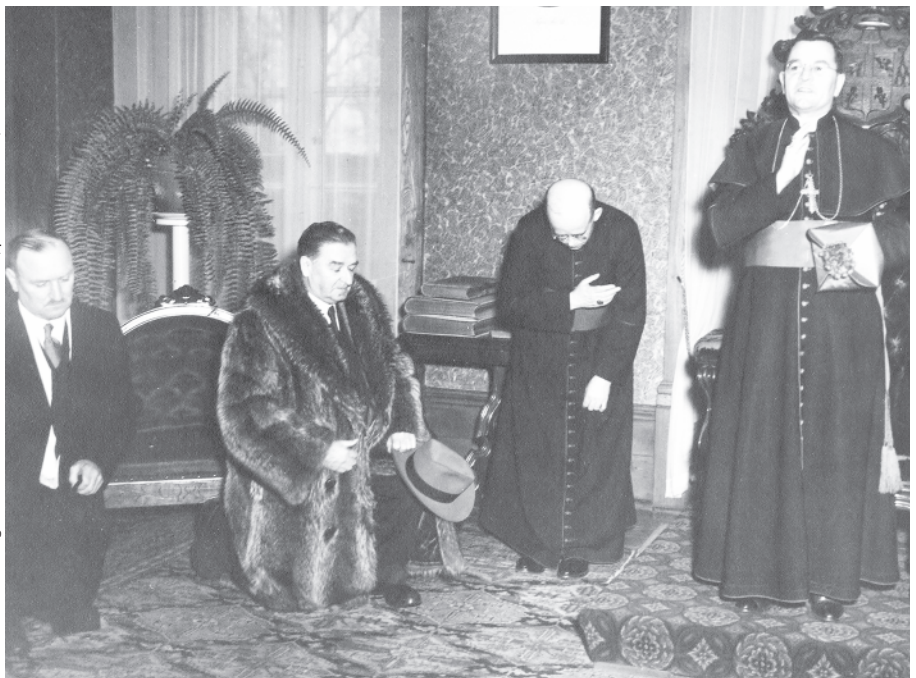
Maurice Duplessis et Georges-Léon Pelletier, évêque de Trois-Rivières, entre 1947 et 1959.