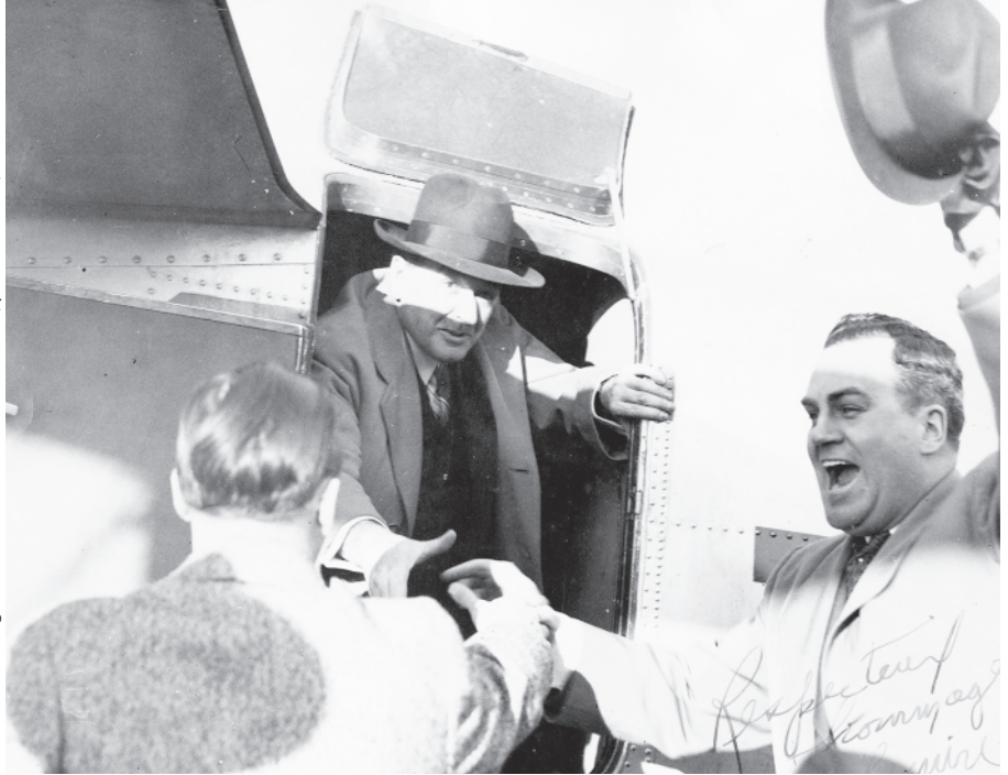
Maurice Duplessis, accueilli par Maurice Bellemare, à l'aéroport de Cap-de-la-Madeleine en 1946.