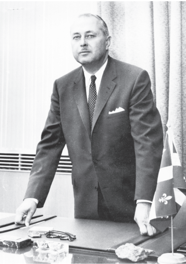
Joseph-Mignault-Paul Sauvé, premier ministre du Québec en 1959.

Les libéraux axent leur campagne sur le thème : « Houde, c'est l'anarchie, Taschereau, c'est l'ordre. » Et, par principe, à cause de la crise, le premier ministre ne fait aucune promesse extravagante aux électeurs. p. 91, chap. 5: 1931-1932