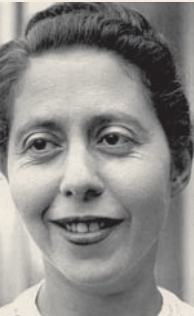
Irène Némirovsky, n° 84

Le prisme des méconnus est large et de belles découvertes ont été faites. Ainsi en est-il de « l'œuvre interrompue » d'Irène Némirovsky*, présentée dans Nuit blanche quelques années avant l'attribution posthume du Renaudot à l'auteure de Suite française (prix qui entraînera la réédition de toute son œuvre), de l'envoûtant Journal de Mireille Havet* retrouvé plus de 60 ans après la mort de la « petite poyètesse » ou encore de Jacques Spitz*, qui fut beaucoup plus qu'un maître