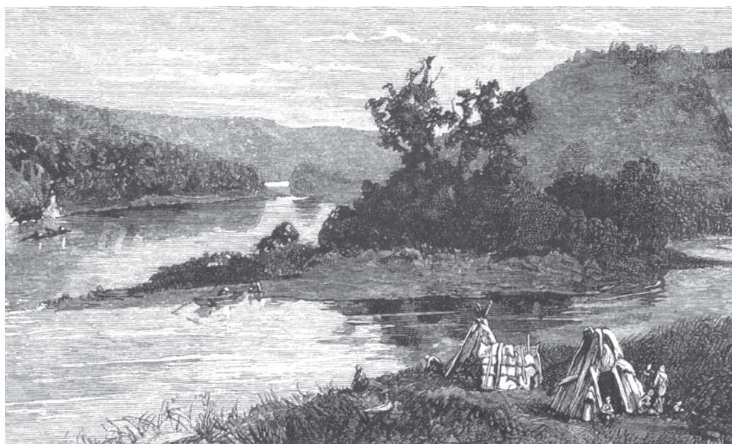
Campement mi'gmaq à la jonction des rivières Listogotjg (Ristigouche) et Matapegiag (Matapédia), 1883. Image : Henry Sansham, collection Jean-Marie Fallu.