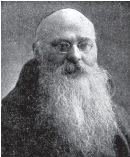
Le père Pacifique De Valigny.