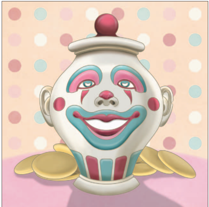
illustration : Laurine Spehner

Faire apparaître quatre biscuits à la fois était probablement trop exigeant pour une vieille jarre comme moi! La prochaine fois, je ménagerai mes forces. Mieux encore : je prendrai de l'avance et je confectionnerai mes biscuits avant l'ouverture de la banque