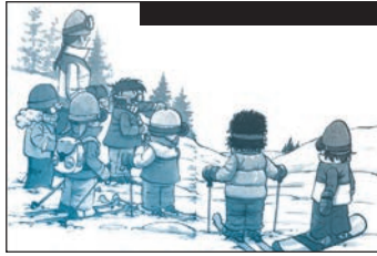
Illustration de Sampar pour La classe de neige .