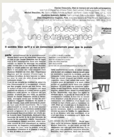
Une page olé ! olé ! du numéro 58. Pas facile à lire !