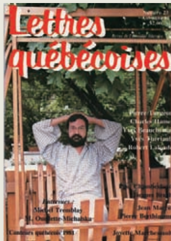
Michel Tremblay. Une des premières photos d'auteur réalisées par Adrien Thério.