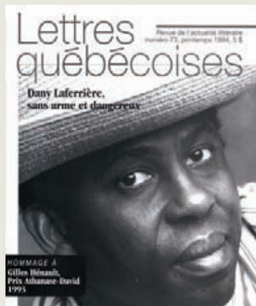
Danny Laferrière en noir et blanc!

liste au Prix du Conseil des arts de la Communauté urbaine de Montréal. Et puis, quelques années auparavant, Lettres québécoises avait reçu les félicitations du jury de ce même Conseil des Arts du Canada pour sa qualité !