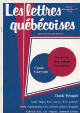
Un numéro « géométrique » réussi. À noter aussi le nouveau logo de Lq.