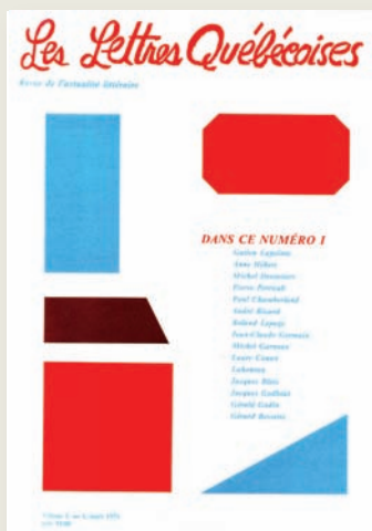
Le premier numéro ne payait vraiment pas de mine.