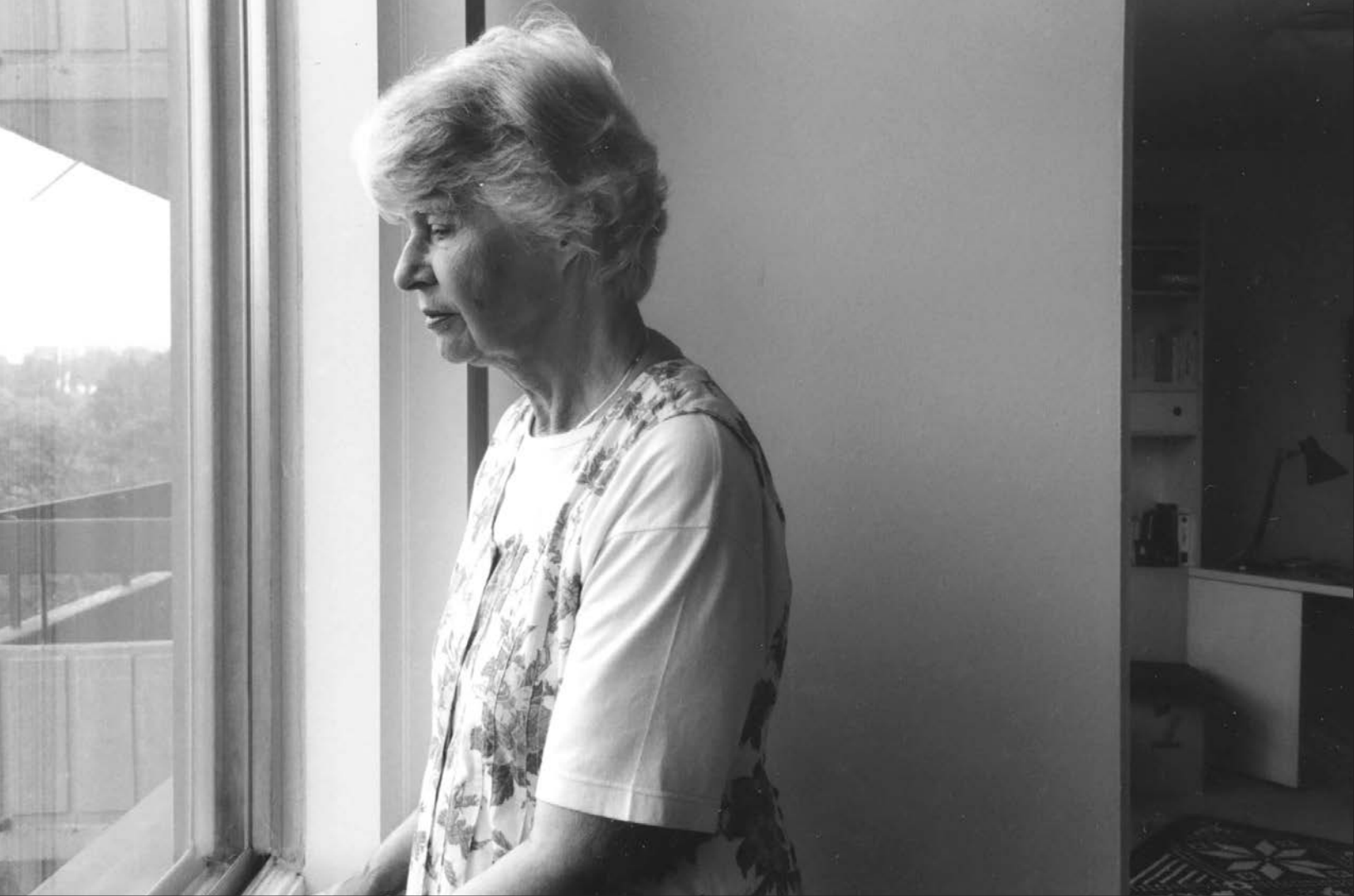
Anne Hébert devant la fenêtre de son appartement montréalais.