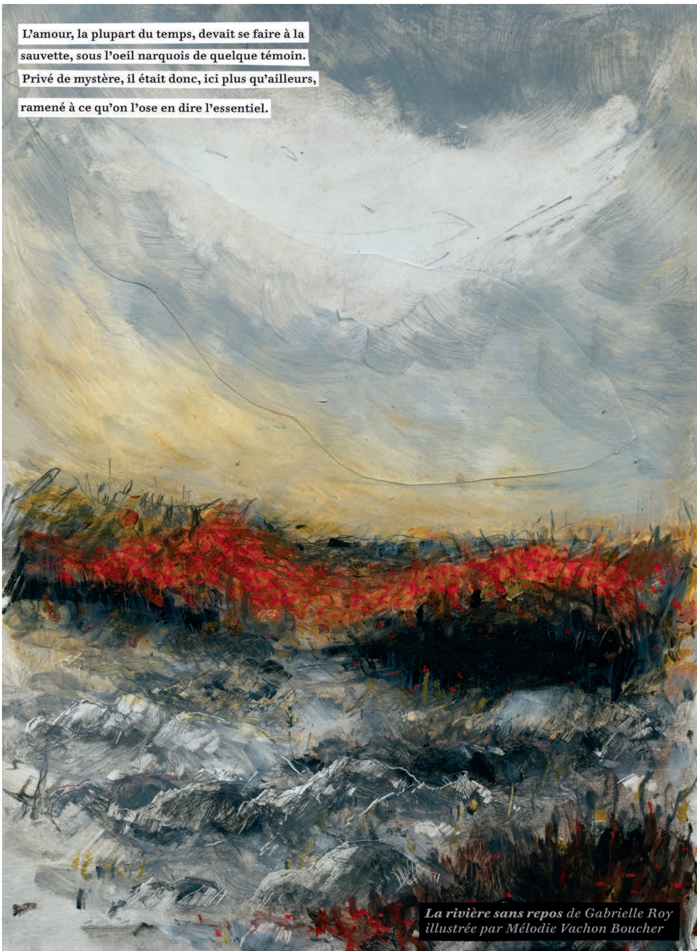
La rivière sans repos de Gabrielle Roy illustrée par Mélodie Vachon Boucher

L'amour, la plupart du temps, devait se faire à la sauvette, sous l'oeil narquois de quelque témoin. Privé de mystère, il était donc, ici plus qu'ailleurs, ramené à ce qu'on l'ose en dire l'essentiel.