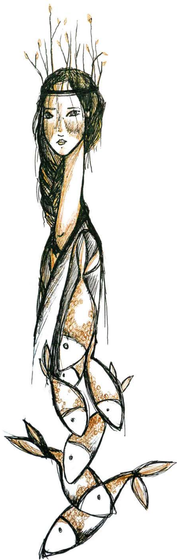
Illustration : Audrée Wilhelmy

Sur les autoportraits que j'esquisse dans mes cahiers, rien n'est visible du ventre ou des mains. Il reste les cheveux, ils encadrent les traits habituels ; front, sourcils, yeux, nez, bouche. Ce visage-là m'apparaît secondaire et je peux le dessiner très lisse. Je le contrôle bien. Je sais le placer pour une photo, dans les conférences, les rencontres d'auteurs, si mes mains sont libres de bouger comme elles veulent, lui demeure ouvert et concentré. (Lorsque je parle, ça se gâte parce que je grimace beaucoup,