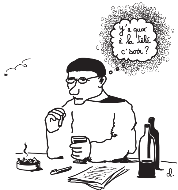
L'auteur de La société du spectacle en proie à l'angoisse du désœuvrement.

Je suis toujours étonné d'avoir une mémoire si précise de ces années-là, de l'atmosphère, surtout, qui régnait à la