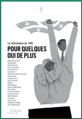
Le référendum de 1995. Pour quelques oui de plus Collectif Somme toute

Venez assister à nos conférences à Montréal ou à Québec et procurez-vous l'un de ces quatre livres dans une librairie indépendante.