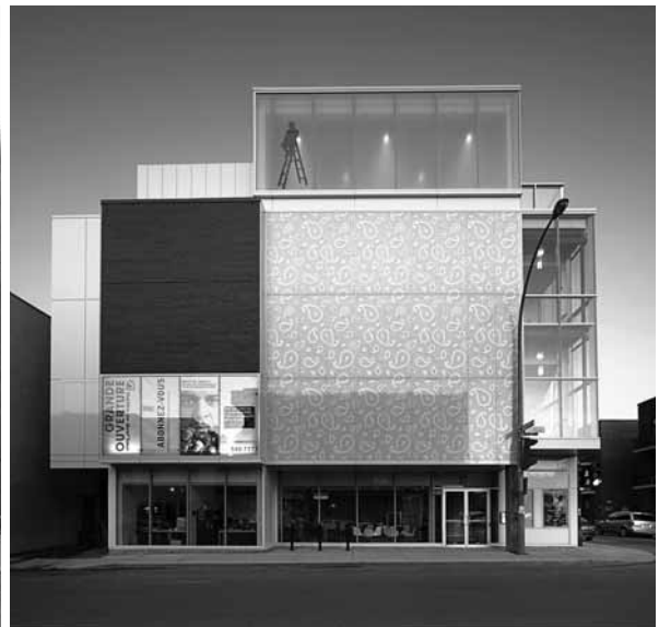
À GAUCHE : Fête de fermeture de l'ancien théâtre de Quat'Sous en juin 2007.