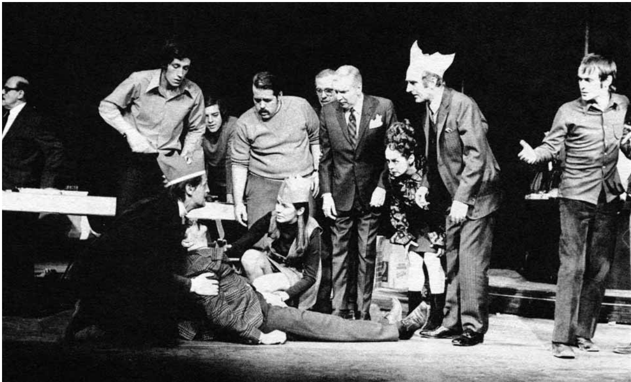
Médium saignant de Françoise Loranger, mis en scène par Yvan Canuel (Comédie-Canadienne, 1970). Photo parue dans l'édition du texte (Leméac, 1970), sans crédit, n. p.

CI-CONTRE : Au moment de sa création au TNM en 1978, la pièce de Denise Boucher, Les fées ont soif , a soulevé les passions, notamment à propos de la censure. Montage de coupures de presse de l'époque accompagnant le texte (Éditions Intermède, 1978, p. 21).