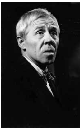
« Bousille, sorte de Woyzeck du provincialisme ». Gratien Gélinas dans le rôle-titre de sa pièce, Bousille et les justes (1959).

La grande affaire de l'art, c'est la rencontre. Sans spectateurs, le théâtre est absurde. Par la force des choses, donc, les stratégies d'approche préluant à la rencontre du public sont un problème artistique crucial. Un théâtre d'intention subversive ne peut faire l'économie de son approche du spectateur. On connaît la discussion autour de l'agit-prop des années 30. Cette forme militante ciblait un public à convaincre, mais ne remplissait ses salles que de déjà convaincus. Bien des artistes de gauche contestèrent ce théâtre ne s'adressant qu'à des auditoires gagnés d'avance.