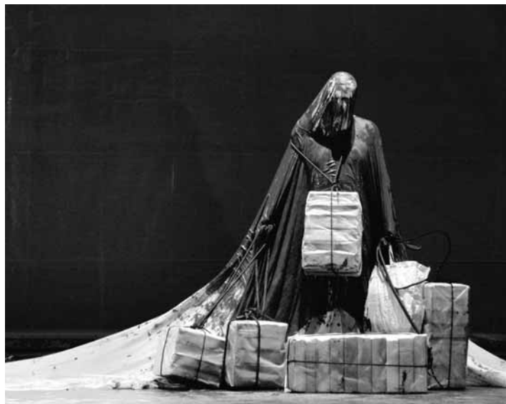
Littoral de Wajdi Mouawad, présenté dans la Cour d'honneur du Palais des papes à l'occasion du Festival d'Avignon 2009.