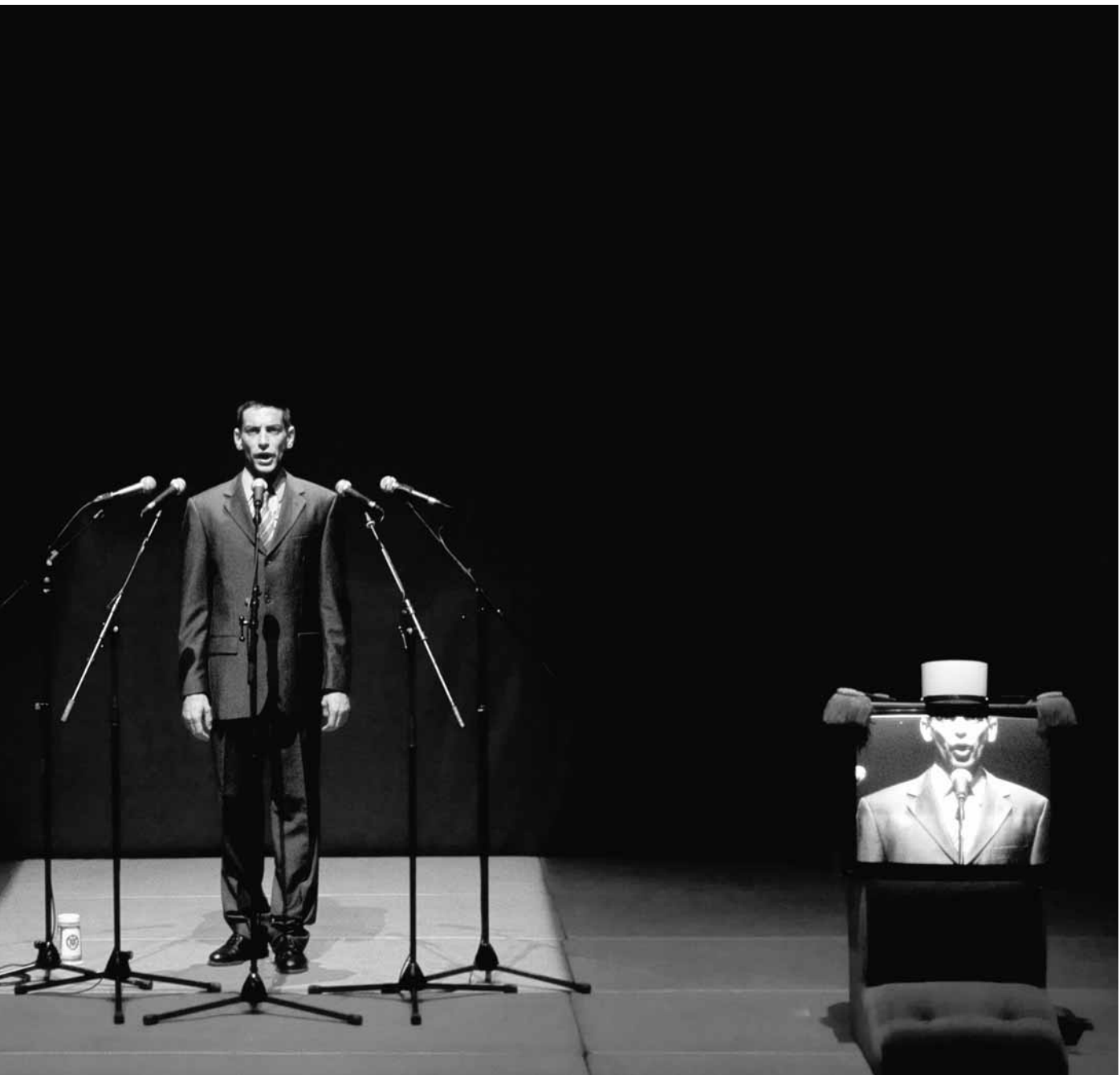
Mon képi blanc , mis en scène par Hubert Colas au Festival d'Avignon 2009. © Sylvain Couzinet-Jacques.