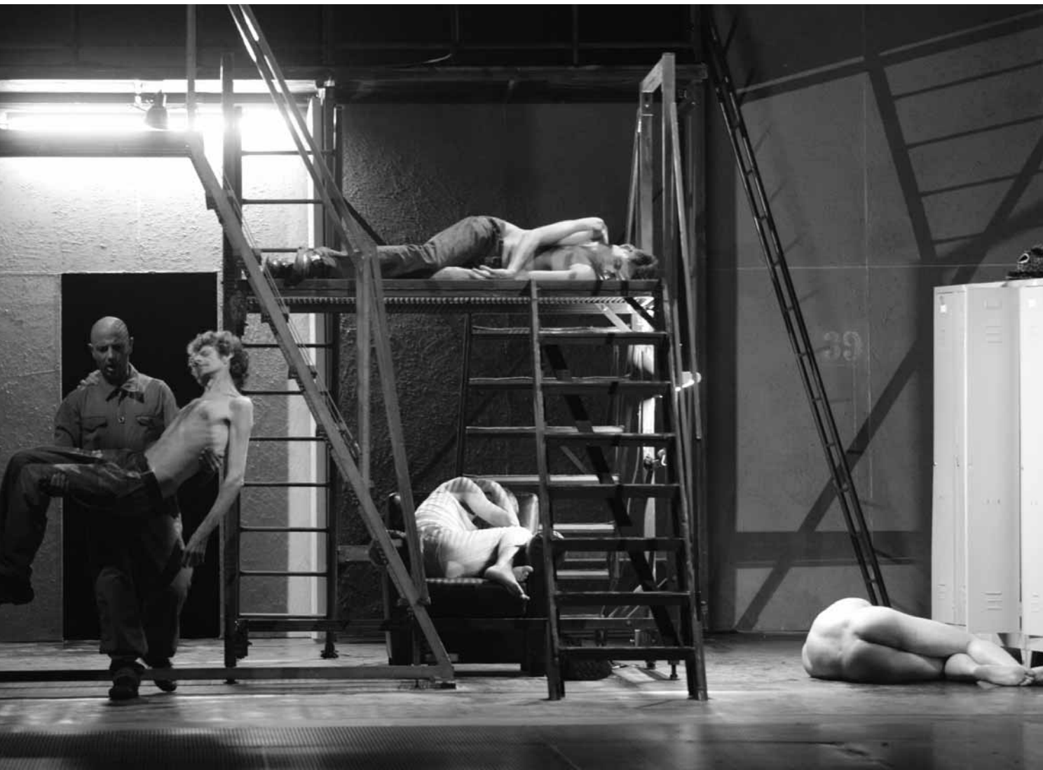
La Menzogna de Pippo Delbono, présentée à Avignon en 2009.

rattrapées par la grande humanité qui se dégage de son travail, par le regard attendri qu'il pose sur le monde et la contribution de sa singulière équipe d'interprètes. Gianluca le trisomique et Bobo le microcéphale sont de la partie, touchants et vrais comme eux seuls savent l'être. Mais La Menzogna n'a rien du lyrisme et du caractère hétéroclite de Questo Buio Feroce ; c'est une œuvre bien plus noire et malheureusement plutôt unidimensionnelle.