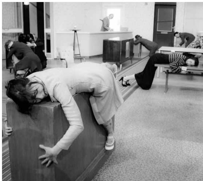
Riesenbutzbach. Une colonie permanente de Christoph Marthaler, présenté à Avignon en 2009.