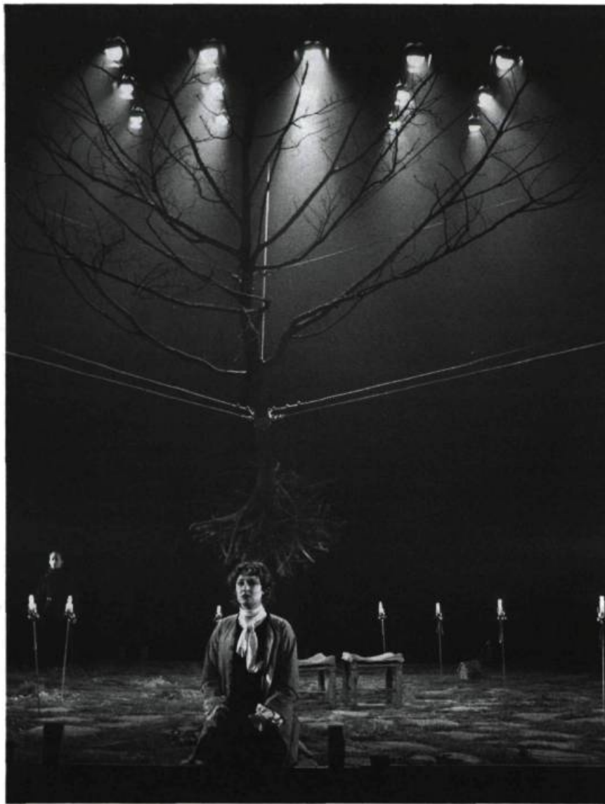
« Au centre du plateau était suspendu, par neuf câbles d'acier, un arbre desséché, sans feuilles, aux racines nues [...] »

Arlequin, habillé en paysan, allumait une torche, puis Agis faisait son entrée une chandelle à la main, avant que le soleil ne se lève côté cour ; à mesure que l'intrigue évoluait, les éclairages se déplaçaient côté jardin et indiquaient que l'action durait une journée (Marivaux respecte la règle des trois unités) ; sept chandelles (une par personnage), montées sur des épées fichées dans le sol, illuminaient la scène finale et délimitaient le demi-cercle duquel sortaient les personnages à l'exception d'Hermocrate et d'Arlequin :