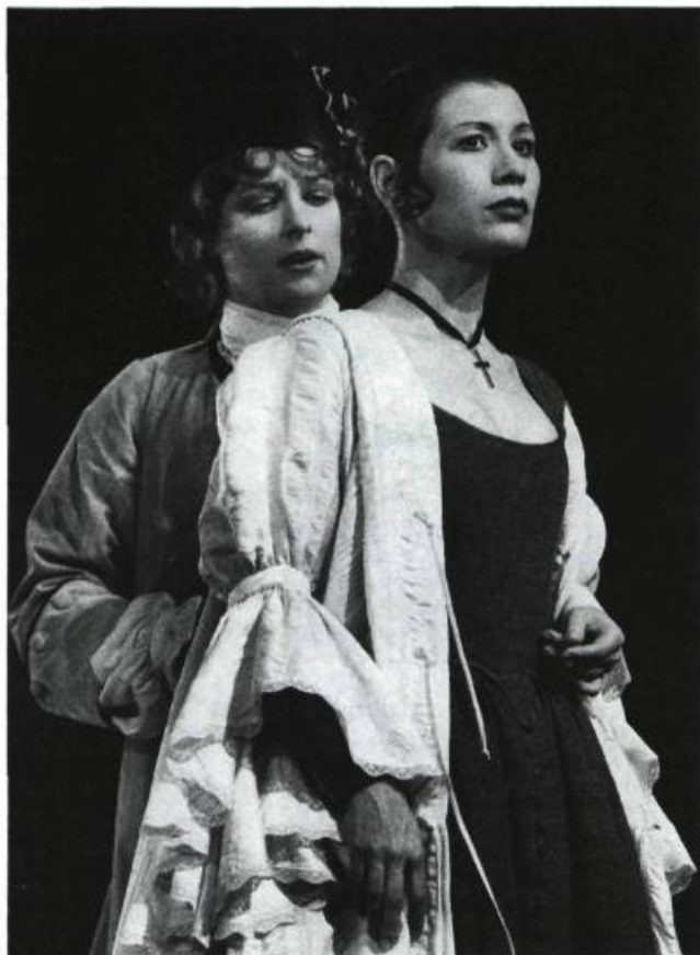
« [...] Léontine, qui avait une croix au cou, portait une robe noire couverte d'une étole blanche, ce qui n'était pas sans évoquer le vêtement monacal. »

Claude Poissant a introduit dans son spectacle un autre aspect de la séduction qui lui, n'est pas explicite dans le texte. Là où les didascalies n'accordent guère de place aux mouvements des comédiens, le metteur en scène a décidé que se rencontreraient des corps sur le plateau, et ces corps acquéraient à l'occasion, pour le spectateur, une identité sexuelle trouble : Léonide, sous le masque masculin de Phocion, se lovait autour de Léontine (acte I, scène 6) et lui posait la main sur la poitrine (acte II, scène 5) ; quand Agis, croyant encore que la princesse était un homme, lui saisissait la cuisse, l'émotion de la jeune fille était grande (acte II, scène 3) ; sous le nom d'Aspasie, Léonide, redevenue femme, se collait contre Agis (acte II, scène 11) ; c'est dans une étreinte qu'elle lui avouait son amour (acte III, scène 5). De son côté, Marivaux n'est jamais allé plus loin qu'au deuxième acte de la Fausse Suivante (1724), lorsqu'il fait raconter au valet Trivelin les gestes de la comtesse et de celui qu'il croit être un chevalier, les baisers qu'ils échangent, les caresses qu'ils partagent ; or, le chevalier est une femme déguisée en homme, et ce sont donc deux femmes qui jouent le jeu de la séduction, mais ce dernier ne saurait accéder à l'espace scénique (Trivelin ne relate que ce qu'il a vu). Poissant, lui, a accentué la sexualisation du travestissement : non seulement ses personnages se déguisaient pour ruser, et