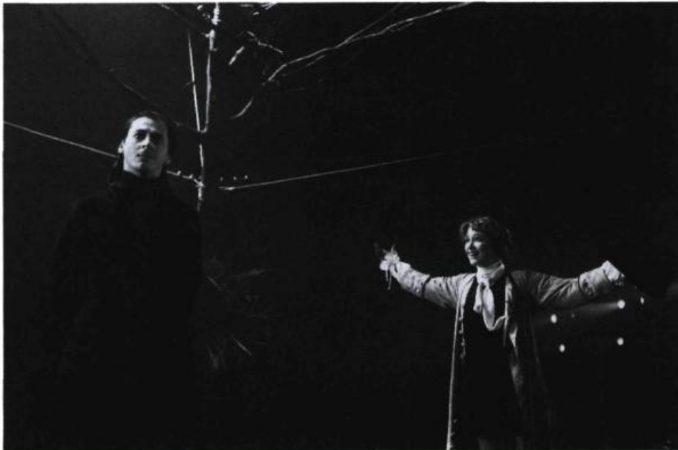
Hermocrate (Luc Picard) : le personnage sombre dans la mise en scène de Poissant « Figé dans son silence et sa superbe, véritable bloc de résistance au langage du cœur [...] ».

Au-delà de cette habileté de Léonide, dont le fondement est son pouvoir aristocratique,