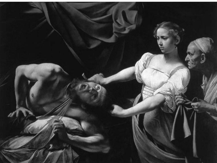
Le Caravage, Judith et Holoferne , 1598. Galerie nationale d'art ancien, Rome.