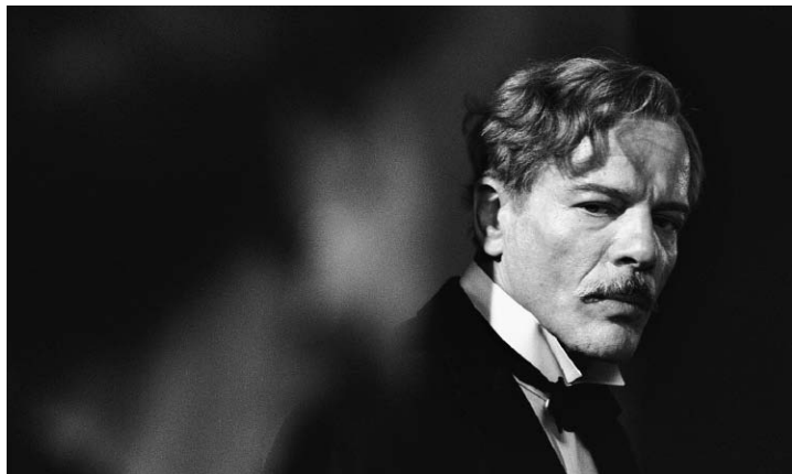
Pascal Gregory dans Gabrielle , film de Patrice Chéreau (2005).

Si le théâtre, et plus largement l'œuvre de Chéreau, est si remarquable, c'est que chacune de ses créations répond au désir intime et puissant qu'il éprouve de porter un texte, de se dévouer à l'œuvre qui devient essentielle à son cheminement. Boulimique de travail certes, et grand perfectionniste, toujours dans l'exigence du texte, la précision du geste, il dit : « Je suis exigeant envers les autres parce que je le suis d'abord avec